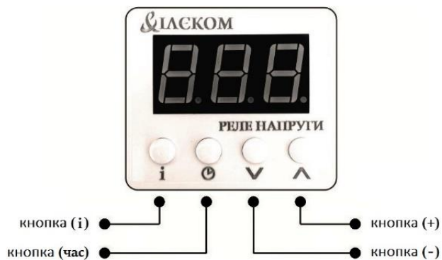
Рисунок 1. Зовнішній вигляд та органи керування

Налаштування здійснюється за допомогою кнопок, розміщених на передній панелі пристрою, рисунок 1. Кнопка «інформація» (i) служить для виклику інформативного меню про аварійні відключення пристрою, версію програмного забезпечення, скидання до заводських налаштувань. Кнопка «час» (час) – для виклику меню налаштування часових параметрів, а також для повернення на головний екран (відображення діючого рівня напруги) з будь-якого меню. Кнопки «плюс» (+) та «мінус» (-) служать для корегування вибраних параметрів та виклику певних налаштувань. Повернення на головний екран із будь-якого пункту меню налаштування чи інформації відбувається автоматично через 5 секунд або при короткочасному натисненні кнопки (час).