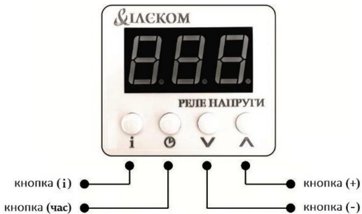
Рисунок 1. Зовнішній вигляд та органи керування

Налаштування здійснюється за допомогою кнопок, розміщених на передній панелі пристрою, рисунок 1. Кнопка «інформація» (i) служить для виклику інформативного меню про аварійні відключення пристрою, версію програмного забезпечення, скидання до заводських налаштувань. Кнопка «час» (час) – для виклику меню налаштування часових параметрів, а також для повернення на головний екран (відображення діючого рівня напруги) з будь-якого меню. Кнопки «плюс» (+) та «мінус» (-) служать для корегування вибраних параметрів та виклику певних налаштувань. Повернення на головний екран із будь-якого пункту меню налаштування чи інформації відбувається автоматично через 5 секунд або при короткочасному натисненні кнопки (час).