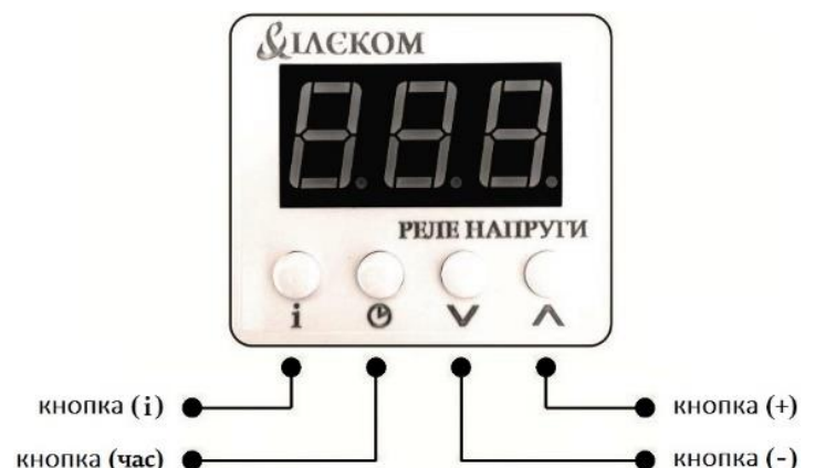
Рисунок 1. Зовнішній вигляд та органи керування

Налаштування здійснюється за допомогою кнопок, розміщених на передній панелі пристрою, рисунок 1.